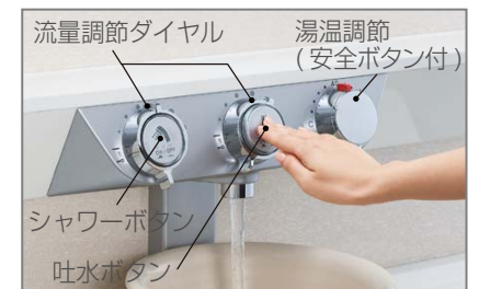
[プッシュ水栓] ※U・Q・Kタイプ標準