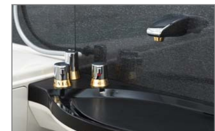
[カウンター埋込み水栓] ※Sタイプ水栓、(メタル仕上げはオプション)