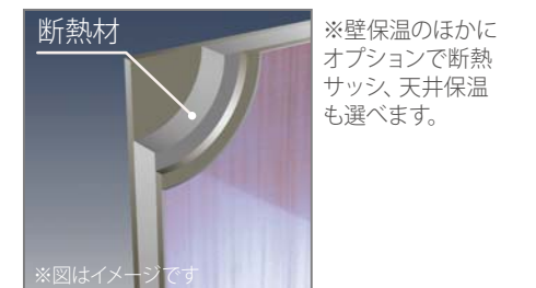
[Lパネル(サンドイッチ仕様)] ※プラスオプション