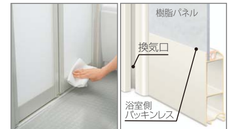
[キレイドア] ※全タイプ標準仕様