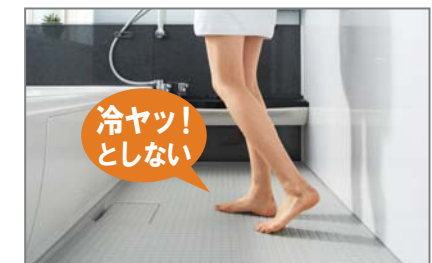
[サーモフロア] ※Eタイプ以外標準仕様