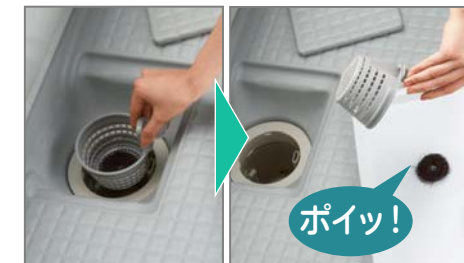
[くるりんポイ排水口] ※全タイプ標準仕様