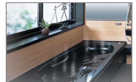
[サーモバスライト] ※保温浴槽標準、組付タコオプション